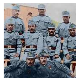
Strhující záznamy ze světové války

Budeme rádi, když informace publikované na našich portálech využijete ke svému osobnímu užítku. V případě žádosti o spolupráci, nebo o jakékoli naše komerční služby, budeme rádi, když nás budete kontaktovat. Děkuje vám za pomoc při aktualizaci publikovaných odkazů.