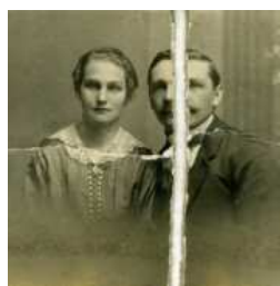
Digitální restaurování starých fotografií na zakázku