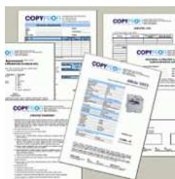
Tvorba názvu – Firemní název ušijeme každému klientovi na tělo