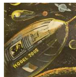
Humorné vzpomínky na 50. léta 20. století