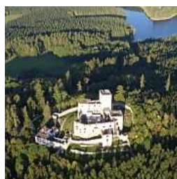
Nový turistický průvodce Slavonice a Česká Kanada